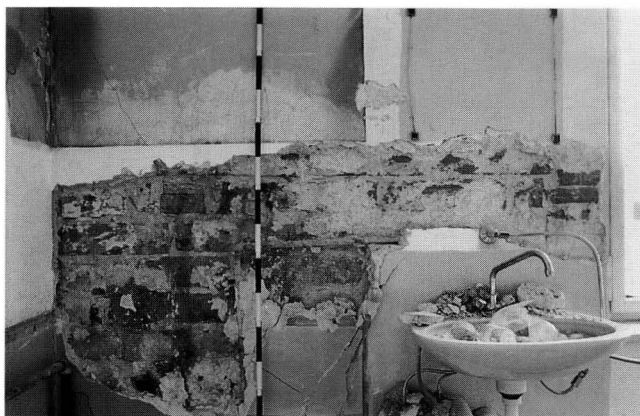
Abb. 6. Nordfassade im 3. Obergeschoss (Seite Kohlenberg bzw. Barfüsserplatz). Element aus grossformatigen Backsteinen, vermutlich 16. Jh.

gedeckt gewesen sein. Erst später, eventuell 1812, ist die Treppe in der Südwestecke des Hauses eingebaut worden.