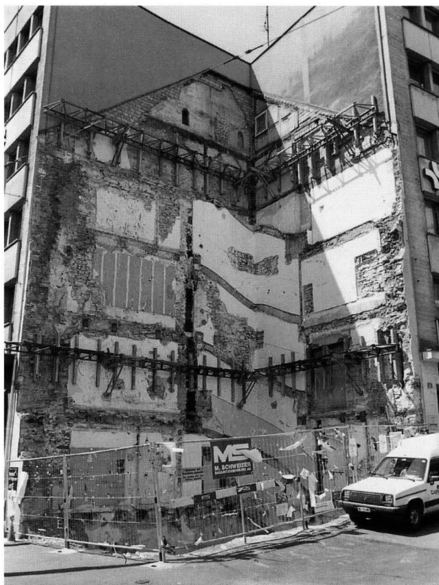
Abb. 7. Die Baustelle nach Abbruch des Hauses zum Bremgarten, Mai 1994.

Bei der Untersuchung ist ein Gebäude mit drei Obergeschossen nachgewiesen worden, das bereits im frühen 14. Jahrhundert schräg vor dem Eselturm und in gerader Linie vor dem Durchlass in der Stadtmauer, dem „Eseltürlein“, erbaut worden war (Abb. 1). Die 1992 archäologisch nachgewiesene Brücke über den Stadtgraben führte direkt auf die Front des hier besprochenen Hauses zu 6 . Die etwas dickeren Hausmauern sind allenfalls auf die überschwemmungsgefährdete Lage des Hauses in der Nähe des Birsigs zurückzuführen. Leider fehlen historische Quellen, die über die Frühzeit des Hauses Auskunft geben, deshalb kann nur darüber spekuliert werden, ob das Haus entsprechend seiner Lage auch einen besonderen Verwendungszweck hatte. Die erste erhaltene Erwähnung des Hauses erfolgte um 1400 im Zinsbuch des Leonhardsstifts: „domus axialis ex opposito porte asinorum“ 7 .