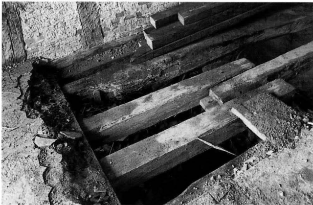
Abb. 5. Balkendecke über dem Keller (Detail), dendrodatiert 1462. Zu erkennen ist der ehemalige Wechsel des Lochs der Kellertreppe, links der Hauseingang.

1462 lag der Abgang in den Keller noch direkt hinter dem Hauseingang, wie die Anschlüsse des ehemaligen Wechselbalkens aufzeigten (Abb. 5). Die Öffnung der Kellertreppe muss mit einer Holzklappe ab-