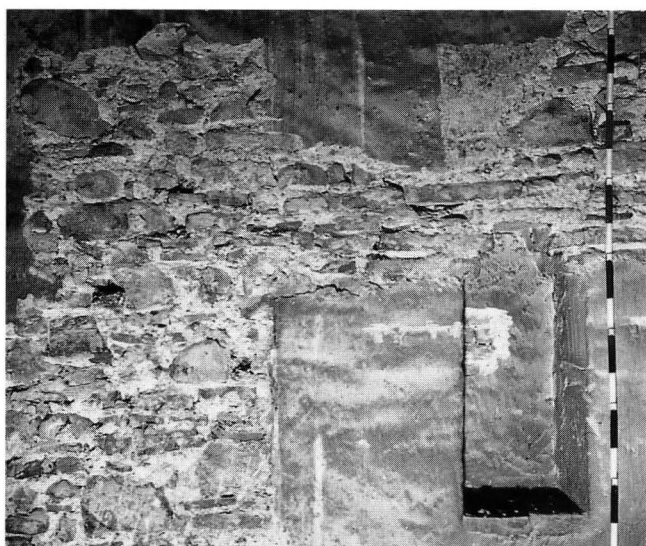
Abb. 3. Südlicher Giebel. Zum Mauerwerk des Giebels gehöriges, spätmittelalterliches Estrichfenster, später zu Nische verändert.

Der südliche Giebel enthielt zwei zugehörige, mit Kragsturz aus Backsteinen gemauerte Estrichfenster, die in einer späteren Phase vom Nachbarhaus her verschlossen bzw. zu Nischen umfunktioniert worden sind (Abb. 3 und 7). Dass das Giebelmauerwerk zumindest spätmittelalterlich ist, darauf deutet eine nachträglich an der Westmauer vorgebaute innere Auf-doppelung mit einem barocken Fachwerkelement im Dach hin.