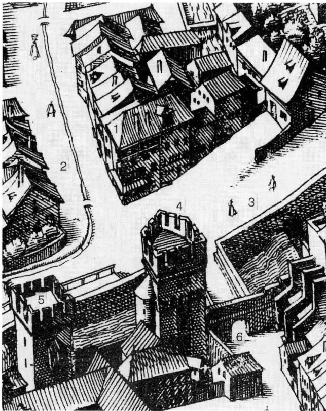
Abb. 1. Ausschnitt aus dem Vogelschauplan der Stadt Basel von Matthäus Merian d.Ä., Blick von Norden, Kupferstich aus dem Jahre 1617.

Trotz der grossen Flickstellen, welche der Einbau der bestehenden Fenster mit sich gebracht hatte, konnte ein über alle vier Seiten des Hauses zusammenhängendes erstes Gebäude im Mauerwerk erkannt werden. Dieser Befund war wegen der vielen Eingriffe erst im zweiten Stock fassbar; das Mauerwerk bestand hier mehrheitlich aus Kalk-Bruchsteinen von rund 40 cm Länge, enthielt aber auch viel Füllmaterial sowie stellenweise Backsteine im "Normalformat" von 32/16/6 cm (Abb. 2). Die Stelle mit den Backsteinen kann nicht als Flick angesprochen werden: Es handelt sich um einen Durchschuss in der Mauer. Das Mauerwerk dieses ersten Gebäudes hatte Verbindung mit den in primärer Verwendung überlieferten dendrodatierten Balken im ersten Stock, war aber durch eine