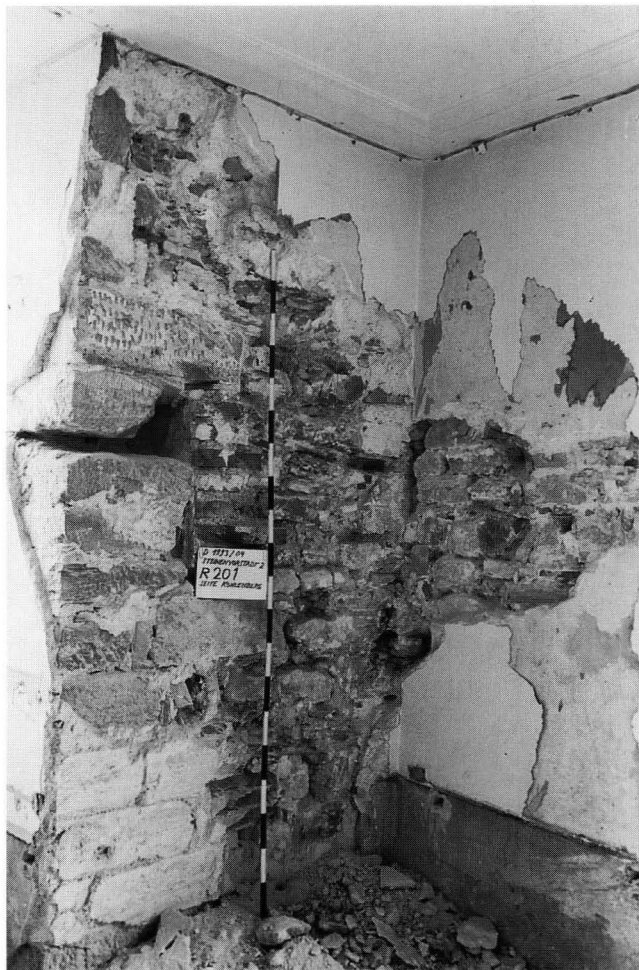
Abb. 4. Nordostecke des Hauses im 2. Obergeschoss. Links vom Täfelchen Rest der Leibung eines originalen Fensters.

Ein auffallendes Merkmal des Originalbestands ist die überlieferte Mauerdicke von rund 75 cm. Genauer: Die platzseitige Fassade im zweiten Stock war so dick, die vorstadtseitige Fassade war rund 60 cm dick. Im dritten Stock betrug die Mauerdicke zum Platz hin bloss 30 cm, war also dünner als die Fassade zur Vorstadt hin mit gut 50 cm. Bei der Untersuchung wurde festgestellt, dass diese dünnere, stadtseitige Fassade eine Ergänzung späterer Zeit ist und vollständig aus Backsteinen gemauert war (wir kommen