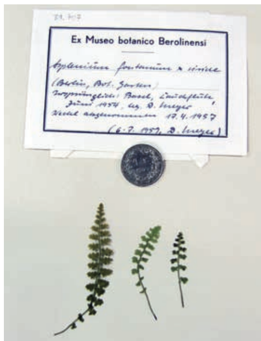
Abb. 3: Herbarbogen von Asplenium fontanum × A. viride . Ein Exemplar dieses äusserst seltenen Bastards wurde an der Lauchfluh bei Eptingen gesammelt und im Botanischen Garten von Berlin kultiviert.

wurde die Ordnung weitgehend so belassen, wie sie beim Beginn der Arbeiten angetroffen wurde. Typenbelege sind im Herbar im Museum.BL keine vorhanden. Als grösste Seltenheit verdient der Bastard Asplenium fontanum × A. viride von der Lauchfluh bei Eptingen Erwähnung (Abb. 3). Eine einzelne Pflanze wurde dort 1954 entnommen und in mehreren Publikationen erwähnt (MEYER 1957, 1962, HESS et al. 1976). Es scheint sich um den einzigen Fund dieses Bastards aus der Schweiz zu handeln, möglicherweise sogar um den einzigen aus Mitteleuropa. Unsere Blätter stammen allerdings nicht vom Originalstandort, sondern von Pflanzen, die im Botanischen Garten in Berlin weiter kultiviert worden waren.